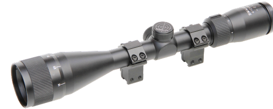
4-12x44 SIMALUX / KK-50